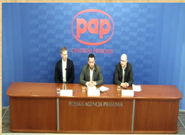
Konferencja prasowa w PAP, działacze Fundacji alarmują o zagrożeniach, które wynikają ze współpracy z wydawnictwami edukacyjnymi.

Członkowie Fundacji, walcząc o poprawę w polskim szkolnictwie spotykają się i współpracują z osobami, oraz organizacjami, dla których edukacja i wychowanie najmłodszego pokolenia nie jest obojętne. Najważniejsze postulaty Fundacja ogłasza na konferencjach prasowych, komisjach sejmowych, itp. Dzięki skuteczności w działaniach, nasze apele często pojawiają się w najważniejszych polskich gazetach, portalach.